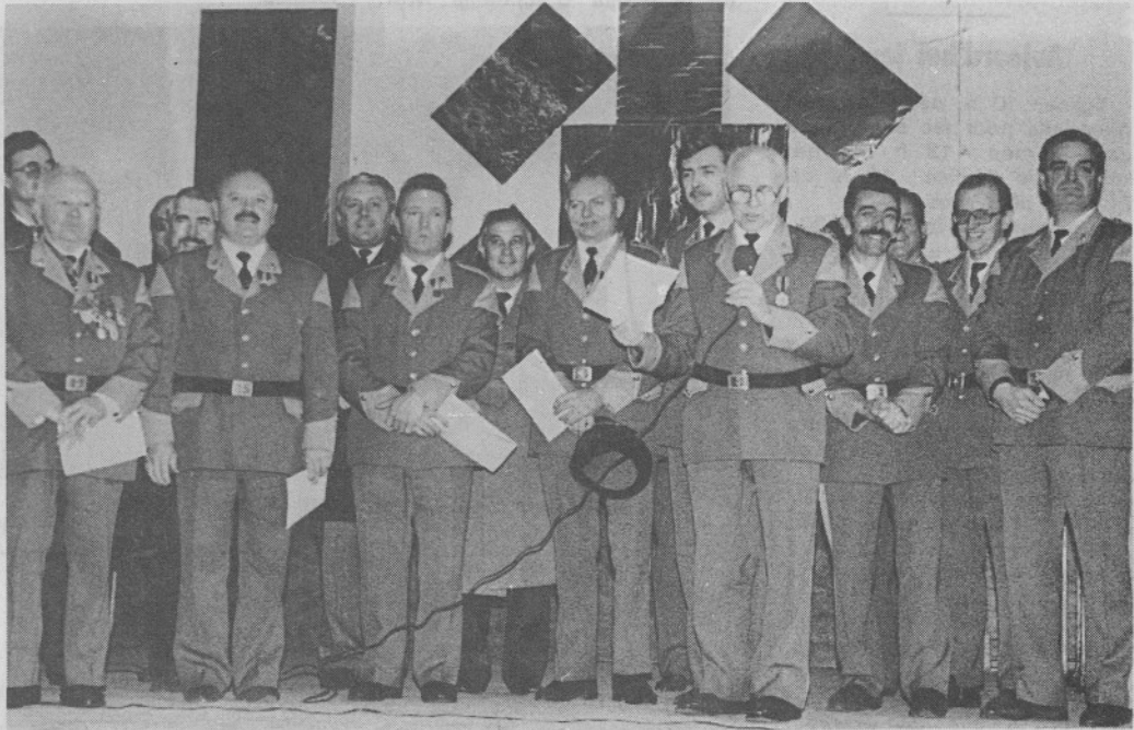
Les médaillés entourés des responsables de la Saint-André et des autorités communales.