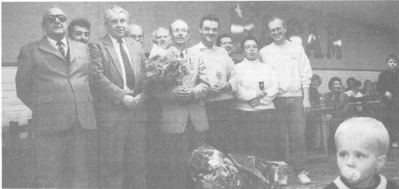
Photo de famille avec les membres, particulièrement méritants.