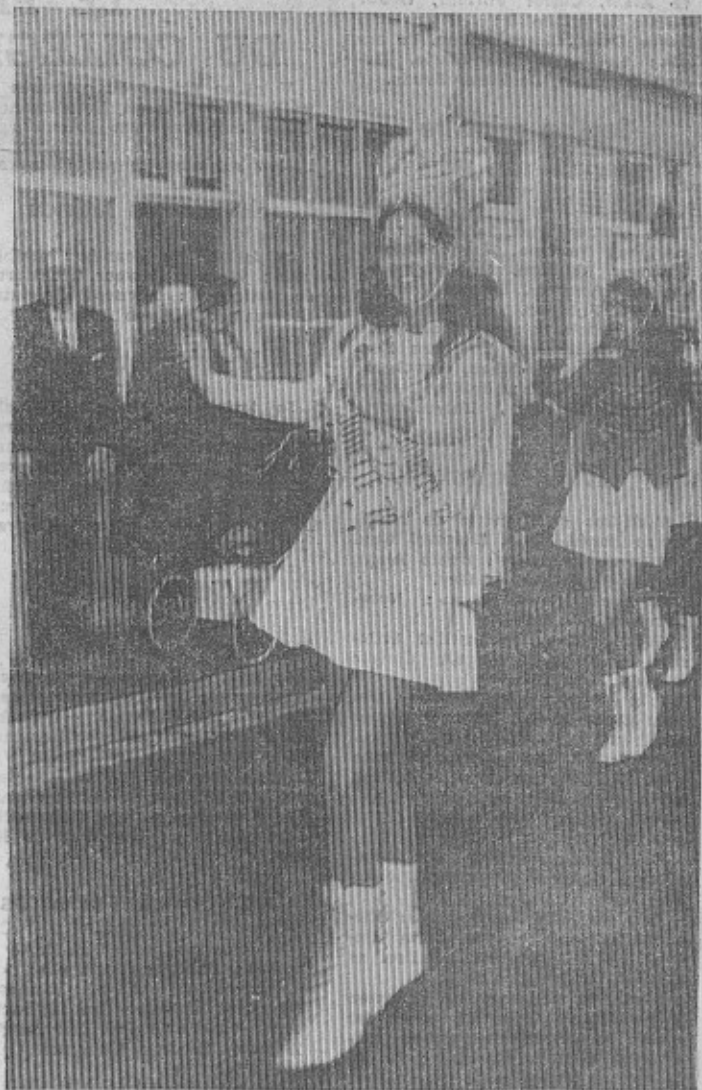
La gagnante du titre national : Miss Majorette 72. (N.E.)