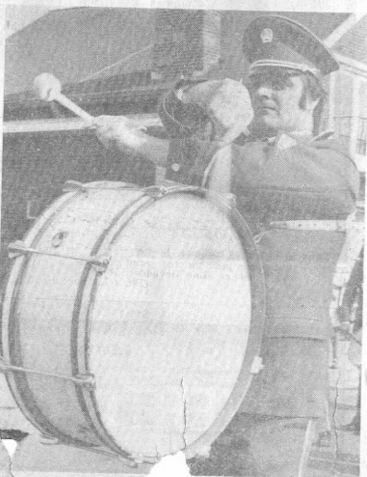
Manier la « mail'