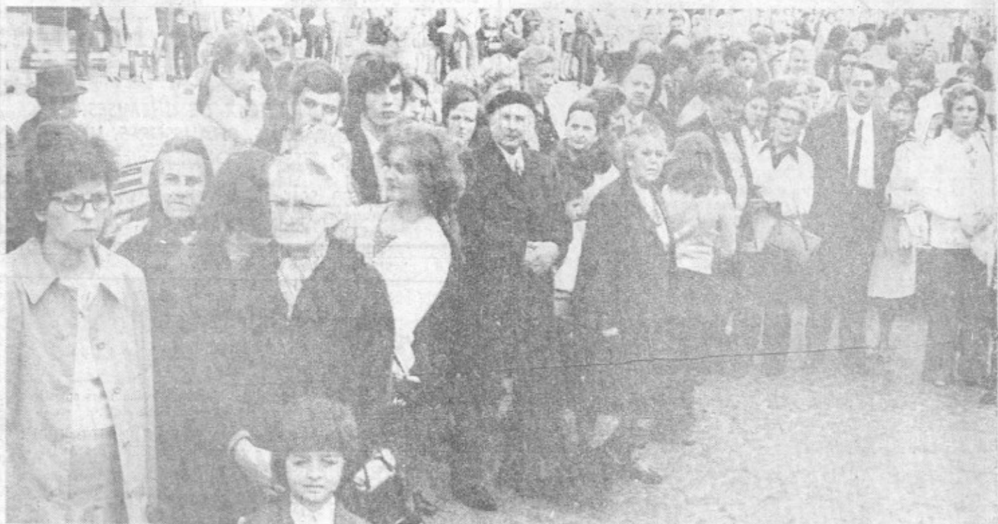
Le public était nombreux à tous les points du parcours.