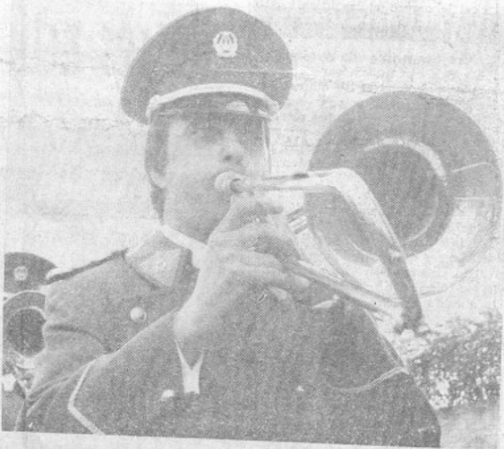
Fière allure, le trombone.