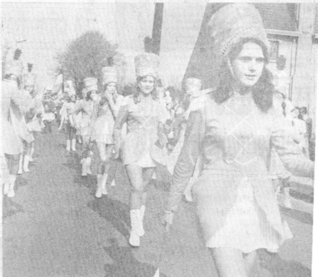
Les majorettes dans leur nouveau costume.