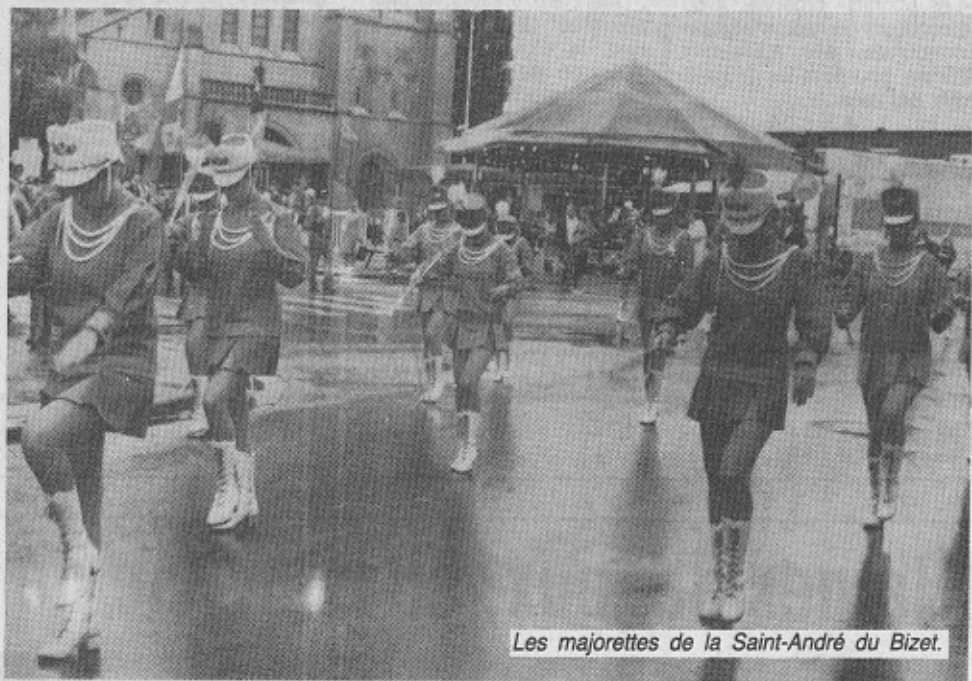
Les majorettes de la Saint-André du Bizet.

Mardi dernier le 21 juillet, belges et français se sont retrouvés, à Warneton, pour célébrer la fête nationale belge : dépôt de gerbes, discours, défilé, réception à l'hôtel de ville, comme nous l'avons déjà re-